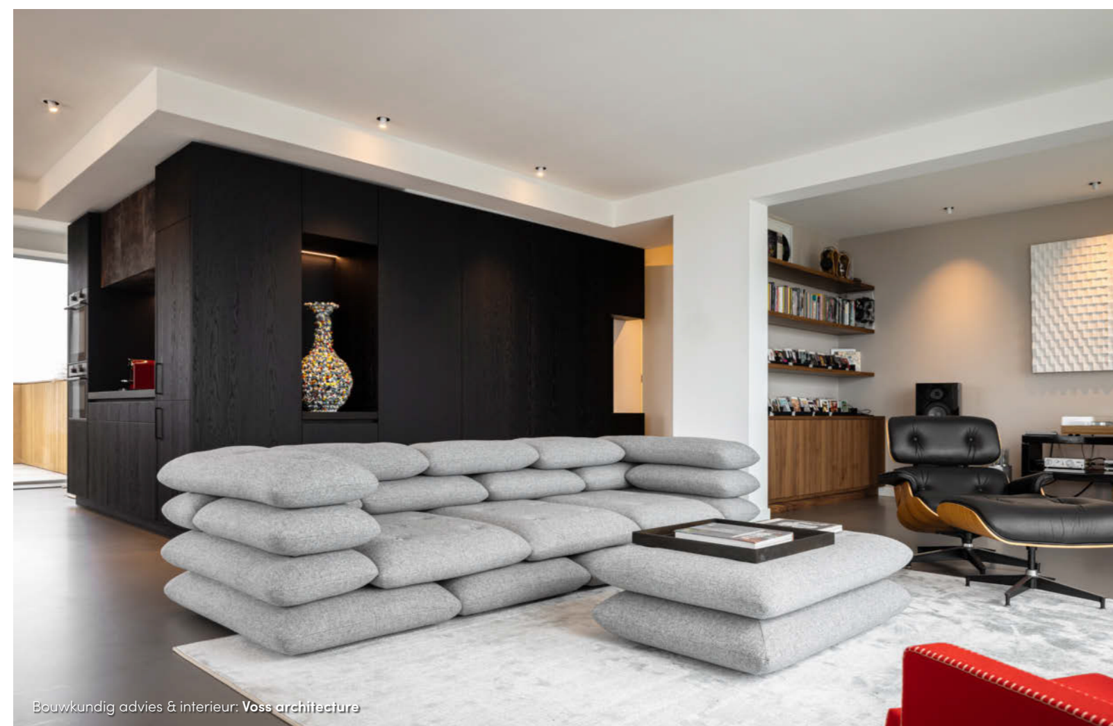
Bouwkundig advies & interieur: Voss architecture

De living bestaat uit een moderne grijze bank in Scandinavische stijl en bijpassende salontafel van stof op een licht getint tapijt. De door de bewoners gekochte bank is door de Deense architect ontworpen die ook het moderne appartementencomplex ontwierp. Zittend op de bank heb je een van de mooiste uitzichten van de woning over het water. Loop je