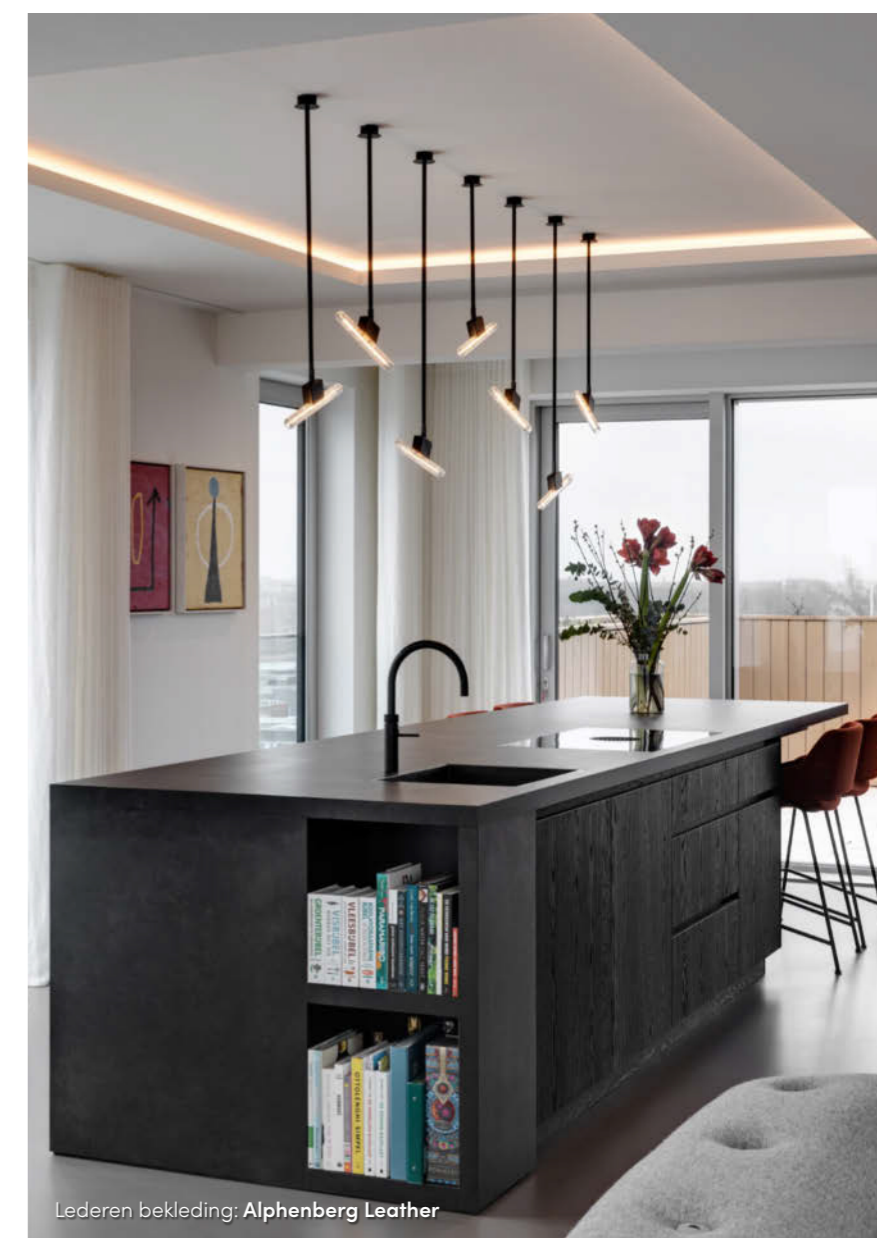
Lederen bekleding: Alphenberg Leather

De grote open leefruimte heeft een donkere gebeitste eikenhouten wandkast die om de hoek overgaat in de keuken. Bert: "We hebben onder meer bij het ontwerp van de wandkast rekening gehouden met de kunst van de bewoners." In de wandkast is speciaal een vak gemaakt, bestemd voor de grote vaas van talloze smurfen: een kleurrijke blikvanger. De ook door Voss ontworpen keuken is een combinatie van leer én hetzelfde materiaal als de wandkast. kleurrijk onderdeel zijn de warm-oranje barkrukken aan het bargedeelte van het kookeiland, die op hun beurt weer mooi passen bij de eettafel, gemaakt van speciaal behandeld oranje hout met een beschermende epoxylaag. Boven de eettafel hangen pendules met twee organisch gevormde armaturen van hout. Over de verlichting vertelt Bert: "Het lichtplan was, net als dat voor al onze projecten geldt, een belangrijk onderdeel in het ontwerp. We hebben de plafonds van het casco opgeleverde appartement iets verlaagd waardoor we de verlichting mooi konden integreren, net als de gordijnrails." Voss heeft delen van het plafond op de oorspronkelijke hoogte gelaten, waardoor er vlakken zijn ontstaan waar indirecte verlichting in de koven zorgt voor een prachtige verlichting. Dat zie je bijvoorbeeld ter hoogte van de keuken.