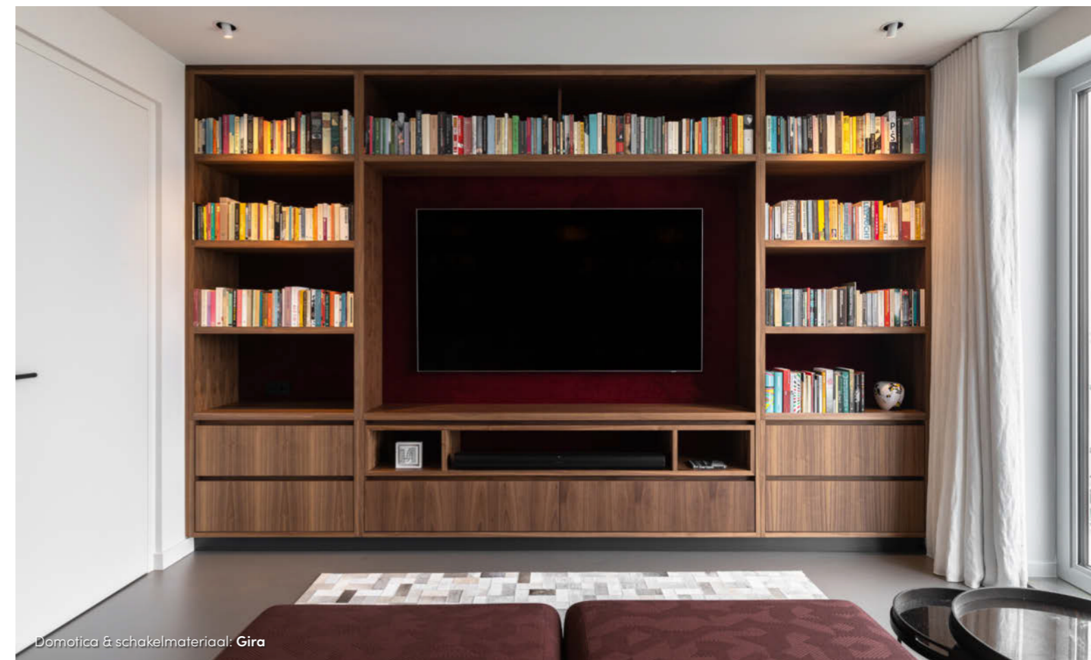
Domotica & schakelmateriaal: Gira