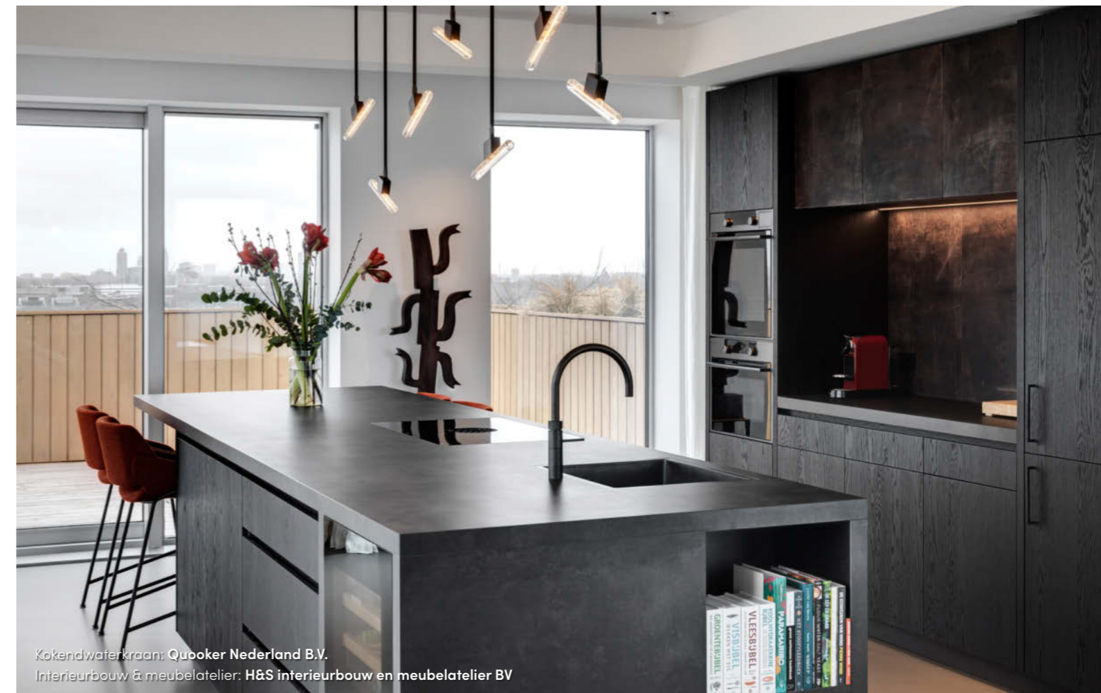
Kokendwaterkraan: Quooker Nederland B.V. Interieurbouw & meubelatelier: H&S interieurbouw en meubelatelier BV

iets verder door dan kom je in het gedeelte van de living waar muziek centraal staat. Deze passie van de opdrachtgever heeft in het ontwerp een duidelijke plaats gekregen. Zo is er ruim plek voor de cd-collectie op de maatwerkkast van walnotenhout en staan de geluidsboxen uitgekend geplaatst bij de klassieke Eames-fauteuil.