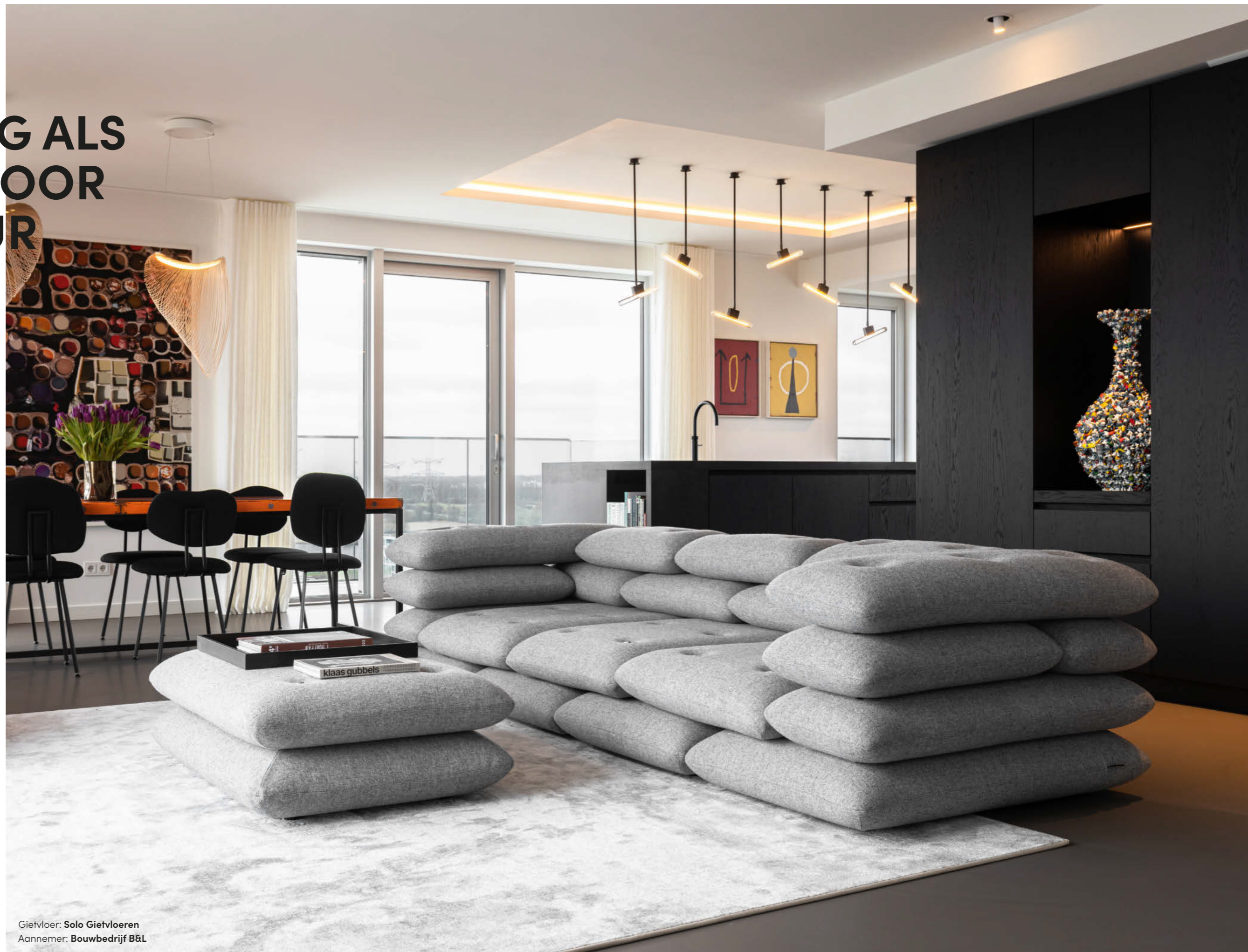
Gietvloer: Solo Gietvloeren Aannemer: Bouwbedrijf B&L

Als jouw appartement hoog is gelegen met een prachtig waterrijk uitzicht, dan wil je daar natuurlijk optimaal van genieten. Voss Architecture beschouwd dit uitzicht als een cadeautje voor het interieur dat ze mochten realiseren voor de eigenaren van dit appartement. Met als resultaat een indeling en inrichting die de bewoners dagelijks laten genieten van hun gloednieuwe onderkomen én de omgeving. Iets wat ze overigens vooraf in 3D met een VR-bril konden ervaren.